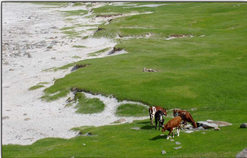
Storfe som beiter på strandenga på Uttakleiv.

Historisk har jordbruket i Lofoten og Vesterålen vært drevet i kombinasjon med fiske eller annen sysselsetting. Å ha en landbrukseiendom var en trygghet og en sikkerhet for familien. Resultatet av dette er at vi har en nokså ensartet eiendomsstruktur med mange små landbrukseiendommer. Driftsformen var basert på oppdyrka areal langs fjæra. Senere kom oppdyrking av myrarealer på strandflata og i dalbotner. Drifta var husdyrhold med storfe, sau hest og geit. Utmarka ble sterkt utnyttet i form av beiting. I dalbotnene var det også frodige grasslier som ble benyttet til utmarksslått. Utformingen av eiendommene er nokså ensarta og utforma ved jordskifte. Karakteristiske eiendommene utforma som ei smal stripe, kanskje ned i 10 meters bredde, fra fjæra til fjells. Bakgrunnen var at alle skulle ha lik tilgang til de ulike arealtypene.