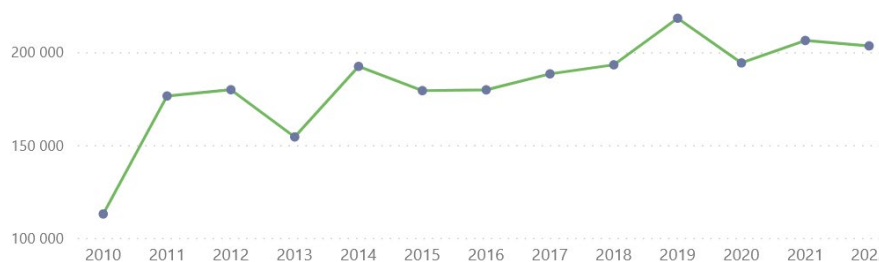
Tabell 4. Totalt antall m3 avvirking for salg i Nordland Kilde: Statsforvalteren i Nordland

Avvirkinga de siste 12 år (2012-2022) for hele Nordland tilsvarer 190 000 kubikkmeter i året. I 2017 ble det hogd 156 000 kubikkmeter gran og 15 000 kubikkmeter furu i Nordland.