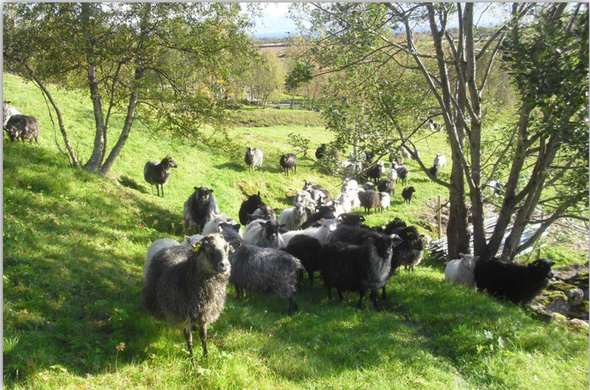
(Gammelnorsk sau som beiter innmarksbeite på Haukenes i Hadsel.) (Baksida: Storfe på utmarksbeite i Risdalen.)

** avhengig av terreng og tilgjengelighet