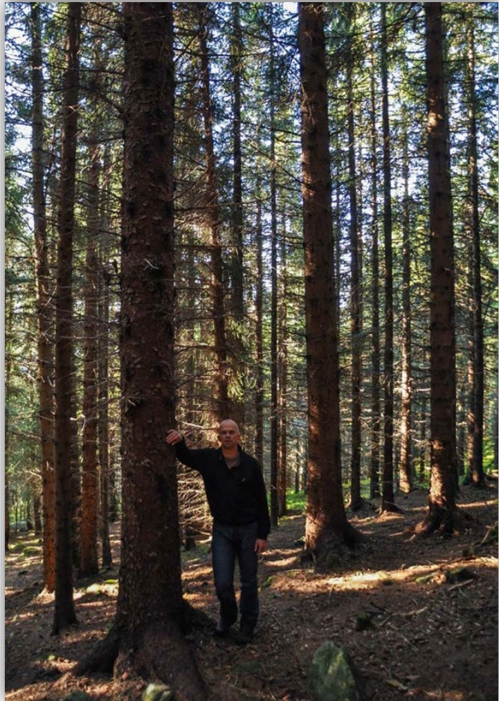
(80 år gammel sitkagran på Steiro. Masse karbonlagring per dekar. Lofoten og Vesterålen har 50 000 dekar med sitkagran og lutzgran.

I en nylig publisert NIBIO-rapport (Andreassen 2019, NIBIO rapport nr. 90) beskrives sitkagrana som en «klimavinner» som i Nord-Norge binder rundt dobbelt så mye karbon som norsk gran per arealenhet. På Vestlandet er karbonbindingen 50 % større i sitkagran enn i norsk gran. Det går fram av rapporten at fra sitkagran er 30-90 år binder ett dekar med sitkagran like mye CO 2 hvert år som to til tre personbiler slipper ut i løpet av et år.