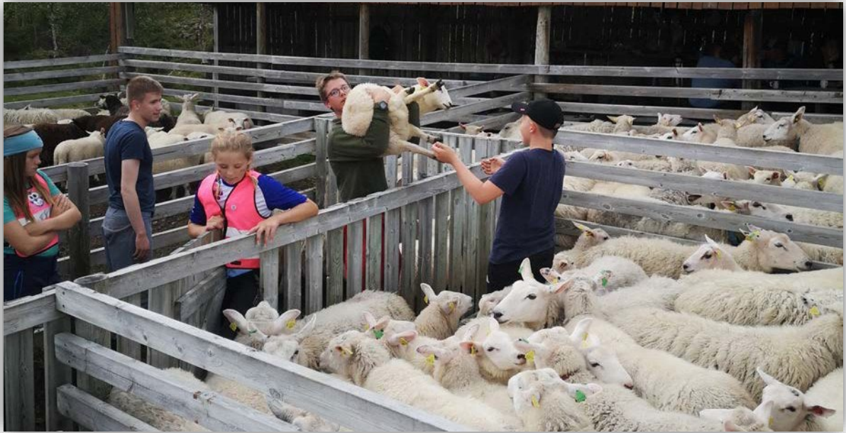
(Sankegrind på Rise, Sortland. Lofoten og Vesterålen har nesten en tredjedel av vinterfora sau i Nordland.)