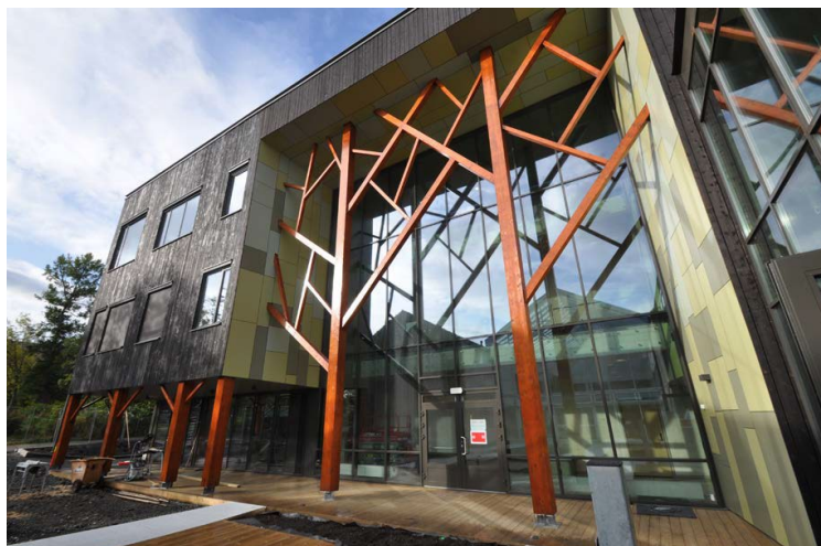
Hadsel videregående skole i massivtre, Foto: Stein Petter Hillestad.