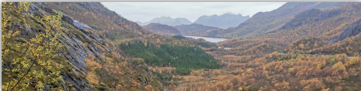
(Bø i Vesterålen)