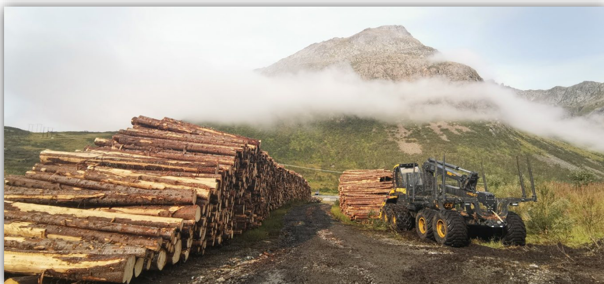
(Luftbåret tømmer etter hogst i Møysalen nasjonalpark)

I Nordland har det vært tradisjon for at bonden selv driftet skogen i kombinasjon med jordbruk. Økte miljøhensyn og den teknologiske utviklingen har ført til at skogsdriften i stor grad settes bort til entreprenører. Det ligger mange utfordringer i disse endringene.