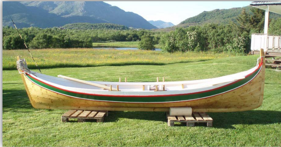
(Nordlandsbåt av sitkagran bygd av Tore Kornbakk på Sortland med båtbord fra skogen til Tor Andersen i Bø og saget på Fjærvollsaga til Nils Erik Klaussen. Foto: Tor Andersen)