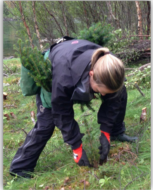
(Planting på Storå, Hadsel kommune)

Hvis forholdene ligger til rette for det, vil det ut fra driftsøkonomiske hensyn være klare fordeler med å anlegge nye plantefelt i naturlig tilknytning til eksisterende kulturskog. Ved etablering av nye plantefelt skal det legges vekt på gode tilpasninger til landskapet på stedet og at det ligger til rette for infrastruktur og driftstekniske løsninger når skogen skal hogges i framtiden.