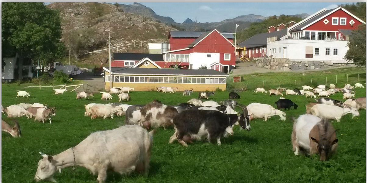
(«Den sorte gryte» gård, Vestbygda, Lødingen kommune)