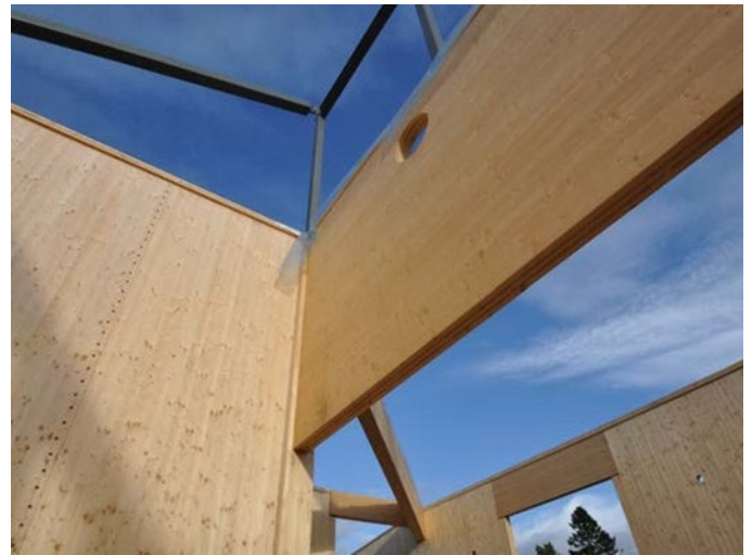
Stokmarknes ungdomsskole, under bygging i massivtre med løsning for fornybar energi.

Kommunevise klimaregnskap for skogbruk og annen arealbruk framgår av oversikter på Miljødirektoratets hjemmesider. Her er det også mulig å hente opp oversikt over utslippene fra jordbruket og 8 andre sektorer (se lenke)