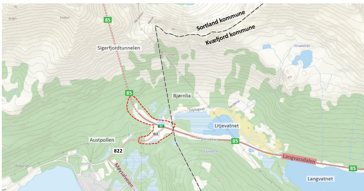
Figur 1: Oversiktskart av planområdet.

Hensikten med endringene er å ivareta naturmangfold og vannmiljø bedre ved å redusere inngrep i myr og bekk, redusere CO 2 -utslipp, bedre trafikksikkerheten og øke samfunnsnyttene ved å redusere utbyggingskostnader.